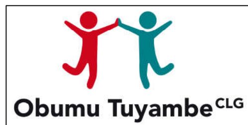
Logo der Organisation